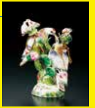
《双口セント・ボトル》イギリス、セント・ジェームズ 1755年頃