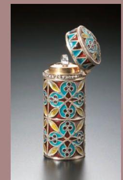
◆初公開 ブシュロン社(香水瓶) フランス 1890-1900年