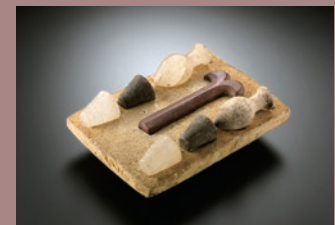
《開口の儀式セット》 エジプト 古王国時代

長年にわたり収集および調査をしてまいりました当館の香水瓶コレクションから、各時代を代表する香水瓶をいつでもご覧いただけます。