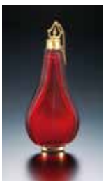
《香水瓶》 フランスまたはボヘミア、金属部分はフランス 1740年頃

香水瓶展示室 長年にわたり収集および調査をしてまいりました当館の香水瓶コレクションから、各時代を代表する香水瓶をいつでもご覧いただけます。