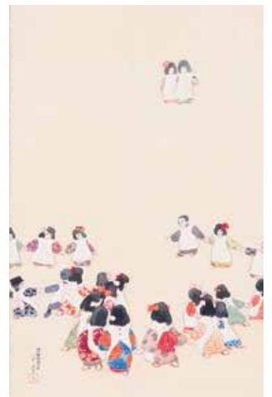
秦テラ《遊戯》1912年(明治45)部分