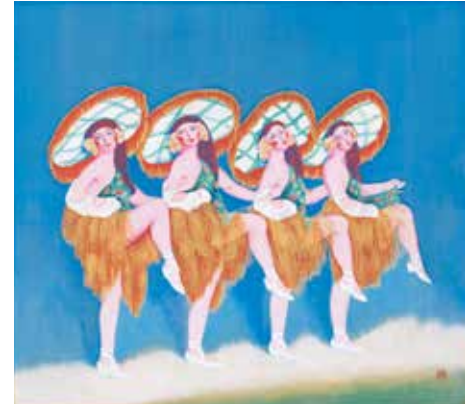
結城素明《踊り子》1926年(大正15)頃