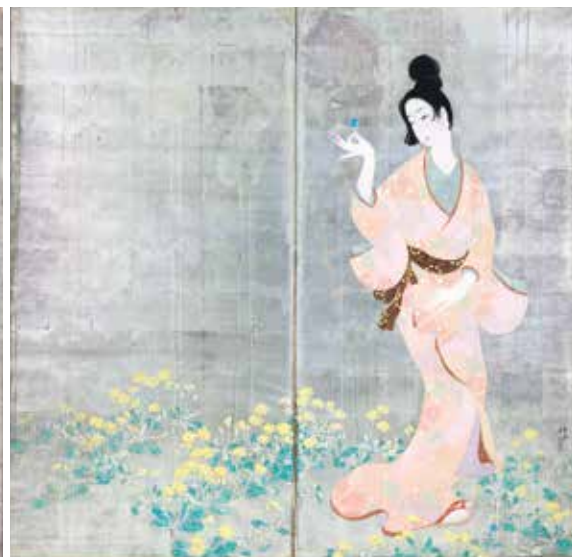
渡辺幾春《春秋美人》大正時代